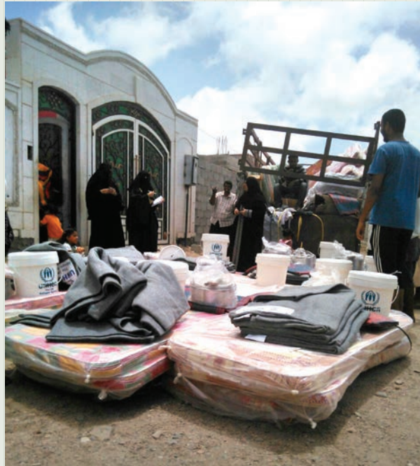
Distribution d'articles de secours, y compris matelas et couvertures, en faveur des déplacés au Yémen.

Le HCR a déclaré vendredi (3 juillet) avoir réussi à livrer du matériel d'aide humanitaire aux personnes déplacées au Yémen en mai et juin malgré de sévères restrictions sur l'accès.