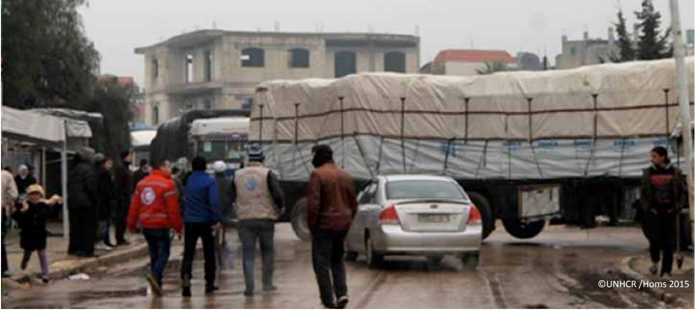
Homs 2015

في 15 كانون الثاني/يناير شاركت المفوضية في بعثة مشتركة بين وكالات الأمم المتحدة عبر خطوط النزاع إلى منطقة الوعر المحاصرة في حمص. حيث ساهمت بإرسال 2,000 مجموعة نظافة، وملابس شتوية لـ1,400 شخص بما فيهم النساء والأطفال، فضلاً عن إرسال 1,000 حفاضة للكبار و5,000 للأطفال. كما شاركت المفوضية في بعثة أخرى بين الوكالات في 20 كانون الثاني/يناير من خلال إرسال ملابس شتوية لـ600 شخص، و3,000 حفاضة للكبار و11,000 للأطفال.