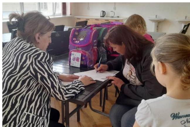
НПО-партнер УВКБ ООН в России "Вера, Надежда, Любовь" оказывает гуманитарную помощь детям-беженцам из Украины, проживающим в ПВР в Пятигорске