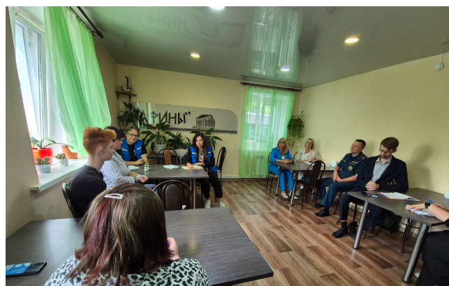
Встреча с беженцами из Украины в Республике Коми