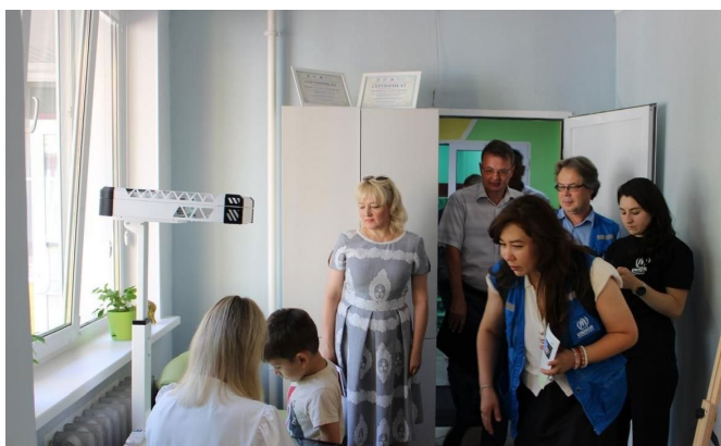
Представители УВКБ ООН осматривают медпункт в ПВР в Республике Мордовия