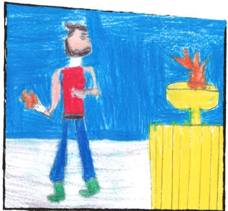
Αγωνίστηκε στους Παραολυμπιακούς Αγώνες και έχει κρατήσει την Ολυμπιακή Φλόγα, μία κίνηση αλληλεγγύης στους πρόσφυγες του κόσμου!