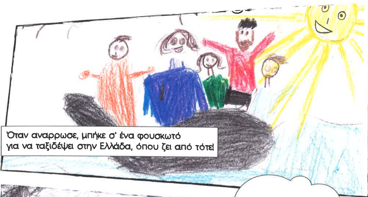
Όταν αναρρωσε, μπήκε σ' ένα φουσκωτό για να ταξιδέψει στην Ελλάδα, όπου ζει από τότε!