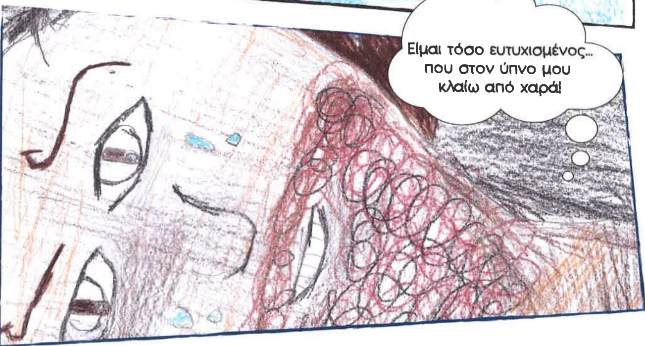
Είμαι τόσο ευτυχισμένος... που στον ύπνο μου κλαίω από χαρά!