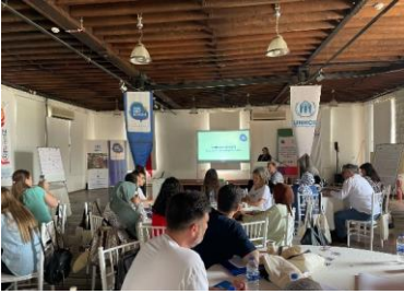
Izmir'deki mülteci kuruluşları ve komiteleri çalıştayda savunuculuk becerilerini geliştirdi.

Antalya'da düzenlenen bir başka eğitime Aile ve Sosyal Hizmetler Bakanlığı Çocuk Hizmetleri Genel Müdürlüğü'nün 71 ildeki çocuk koruma mobil ekiplerinden 100 sosyal çalışmacı katılmıştır. 14-17 Haziran tarihleri arasında yapılan eğitimde aile ve çocuklar için risk faktörleri, travma ve kriz çalışmaları, Türkiye'de yabancılara sunulan sosyal hizmetler, vaka yönetimi, psikososyal destek, hane ziyaretleri, gözetim, öz bakım gibi konular ele alınmıştır.