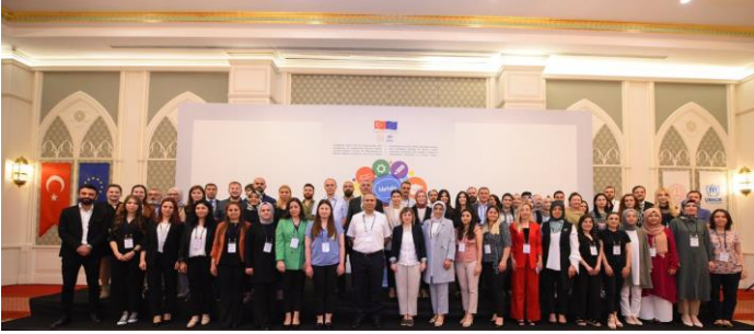
Haziran ayında Halk Eğitim Merkezi öğretmenleri ve yöneticileri için düzenlenen öğretim yöntemleri eğitimi.

UNHCR, Özgürlük İçin Friedrich Naumann Vakfı tarafından Temmuz ayında Çeşme'de düzenlenen İnsan Hakları Akademisi Uluslararası Koruma ve Mülteciler Uluslararası Yaz Okulu 'nda ulusal ve uluslararası yasal çerçeve bağlamında geri göndermeme ilkesi hakkında bir sunum yapmıştır. Yaz okuluna Türkiye, Suriye, Lübnan, Polonya, İspanya, İtalya, Macaristan, Gürcistan ve Bulgaristan'dan katılımcılar gelmiştir. UNHCR Sözcüsü, Mültecilere İlişkin Küresel Mutabakat ve mülteci çalışmaları hakkında bir sunum gerçekleştirmiştir.