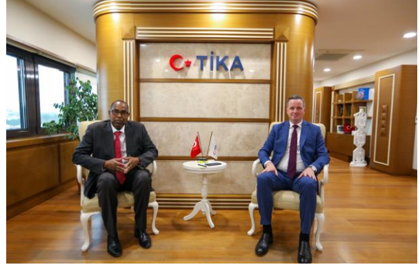
Büyükelçi Mohamed Affey ve TİKA Başkanı Serkan Kayalar istişare toplantısında bir araya geldi.

UNHCR Afrika Boynuzu Özel Temsilcisi Büyükelçi Mohamed Abdi Affey, 6-7 Haziran tarihlerinde Türkiye'ye resmi ziyarette bulunmuştur. Büyükelçi Affey, Dışişleri Bakanlığı, Afet ve Acil Durum Yönetimi Başkanlığı (AFAD), Türk İşbirliği ve Koordinasyon Ajansı Başkanlığı (TİKA), Göç İdaresi Başkanlığı, Yurtdışı Türkler ve Akraba Topluluklar Başkanlığı (YTB), Türk Kızılay yetkilileriyle ve diplomatlarla istişare toplantılarına katılmıştır. Affey, ziyaretlerinde Türkiye'nin Afrika Boynuzu'nda, özellikle de Somali'de oynadığı kilit rolü ve yatırımları gündeme getirmiştir. Bu bağlamda ev sahibi ülkelerin yürüttüğü çalışmalara katkı sağlandığını ve Nairobi Deklarasyonu ve Hükümetler Arası Kalkınma Otoritesi (IGAD) ülkelerinin kabul ettiği Eylem Planı'nda öngörüldüğü üzere, Somalili mültecilere yönelik kalıcı çözümün bir parçası olarak gönüllü geri dönüşlere destek olunduğunu ifade etmiştir.