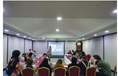
Harran Üniversitesi öğrencileri problem çözme ve çatışma çözümü eğitimine katıldı.

UNHCR ve YTB, Mayıs ve Haziran aylarında Türkiye çapında problem çözme ve çatışma çözümü eğitimleri düzenlemiştir. Eğitimlerden biri Necmettin Erbakan Üniversitesi ile birlikte düzenlenmiş, Türk ve yabancı topluluklardan 100 öğrenciye interaktif sosyal problem çözme ve çatışma çözümü teknikleri aktarılmıştır. 28-29 Mayıs tarihlerinde yapılan eğitimde ise Harran Üniversitesi öğrencilerine ve akademisyenlerine değişimin mimarı olarak gençlerin rolü konulu sunumlar yapılmıştır. Çoğu Suriyeli olmak üzere Zambiya ve Çadlı