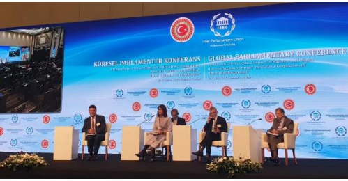
UNHCR Temsilcisi, İstanbul'daki Küresel Parlamenter Konferansı'nda küresel mutabakatlar ve politikalar konulu panele katıldı.

UNHCR, genel merkezindeki Mültecilere İlişkin Küresel Mutabakat ekibiyle birlikte 20-21 Haziran tarihlerinde Parlamentolar Arası Birlik (PAB) ve Türkiye Büyük Millet Meclisi (TBMM) işbirliğinde düzenlenen "Parlamentolar ve Göç ve Mültecilere İlişkin Küresel Mutabakatlar: Daha Güçlü Uluslararası İşbirliği ve Ulusal Uygulama Nasıl Sağlanabilir?" konulu Küresel Parlamenter Konferansı'na katılmıştır. TBMM Başkanı Mustafa Şentop, basın toplantısında sorunun ele alınarak çözüm önerilerinin görüşülmesi için parlamenterlerin bir araya getirilmesi sayesinde küresel göç meselesi hakkında farkındalık uyandırılacağını ve bu küresel sorunla ilgili çözümlerin de küresel ölçekte olması gerektiğini kaydetmiştir. 50 parlamentodan 300 parlamenter ve temsilciyle birlikte 16 meclis başkanı ile başkan vekili ve Türkiye'den üst düzey yetkililer konferansa katılmıştır.