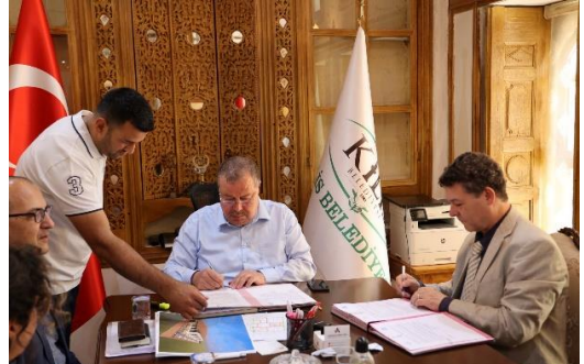
UNHCR ve Kilis Belediyesi, Kilis'te Mutabakat Metni imzaladı.

UNHCR Türkiye Temsilcisi, Temmuz ayının ilk haftasında Kilis, Gaziantep, Mardin ve Şanlıurfa illerini kapsayacak şekilde Güneydoğu Anadolu'ya ziyaretlerde bulunmuştur . Temsilci, bölgedeki valiler, İl Göç İdaresi müdürleri ve belediye başkanlarıyla toplantılar yaparak güncelleme ve gönüllü geri dönüş alanlarını ziyaret ettikten sonra kurum personeliyle, ortaklarla ve üniversite temsilcileriyle görüşmeler gerçekleştirmiş ve UNHCR ve ortakları tarafından geçim kaynakları ve sosyal uyum alanlarında yürütülen proje sahalarını gezmiştir. Ayrıca Türkiye'de Suriyeli nüfusunun Türk nüfusa oranının en yüksek olduğu Kilis'te uluslararası koruma ihtiyacı içindeki kişilere koruma ve hizmetlerin sağlanmasında mevcut işbirliğinin güçlendirilmesi ve yerel toplumlarda sosyal uyumun desteklenmesi kapsamında UNHCR ile Kilis Belediyesi arasında bir Mutabakat Metni imzalanmıştır.