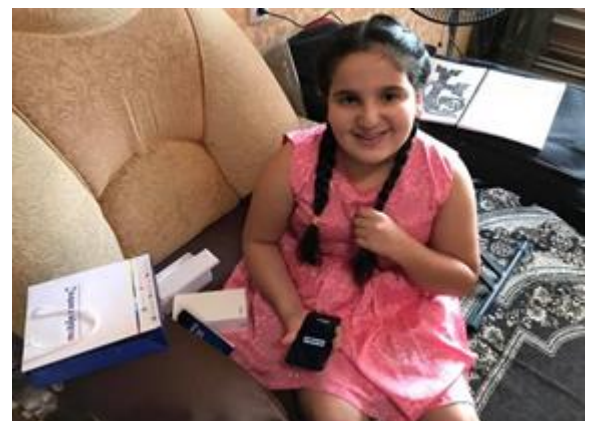
Իրաքցի դպրոցական աղջիկը սկսում է առցանց դասերը մասնավոր նվիրատուից ստացած թվային սարքի շնորհիվ:

Ֆինանսավորման տոկոսային մասը (51%) և ընդհանուր բյուջեն (1,867,659 ԱՄՆ դոլար) ինդիկատիվ են: Արդյունքում, ֆինանսավորման ինդիկատիվ ճեղքը 1,791,702 ԱՄՆ դոլար է, որը պահանջվող ֆինանսական միջոցների 49%-ն է: