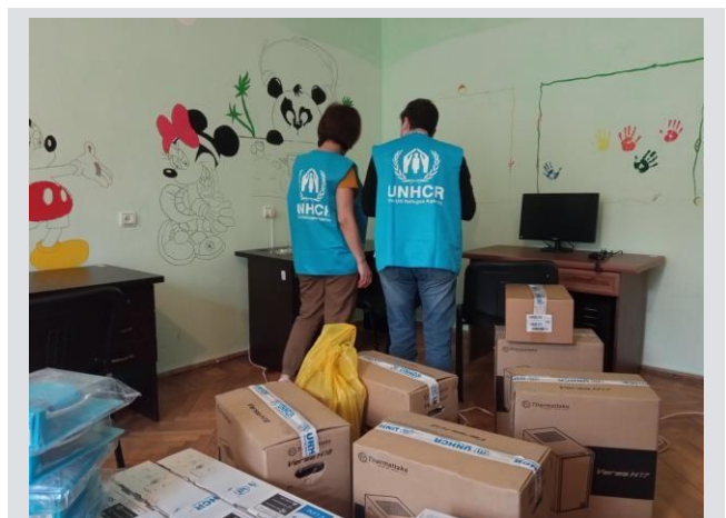
ՄԱԿ ՓԳՀ հայաստանյան գրասենյակի անձնակազմն օգնություն է բաշխում:

Եւ համայնքային աջակցության նախաձեռնություններ են մեկնարկել Հայաստանի տարածքում: Տեխնիկական օժանդակություն է տրամադրվել երկու համայնքապետարանի եւ հինգ համայնքային կազմակերպության: