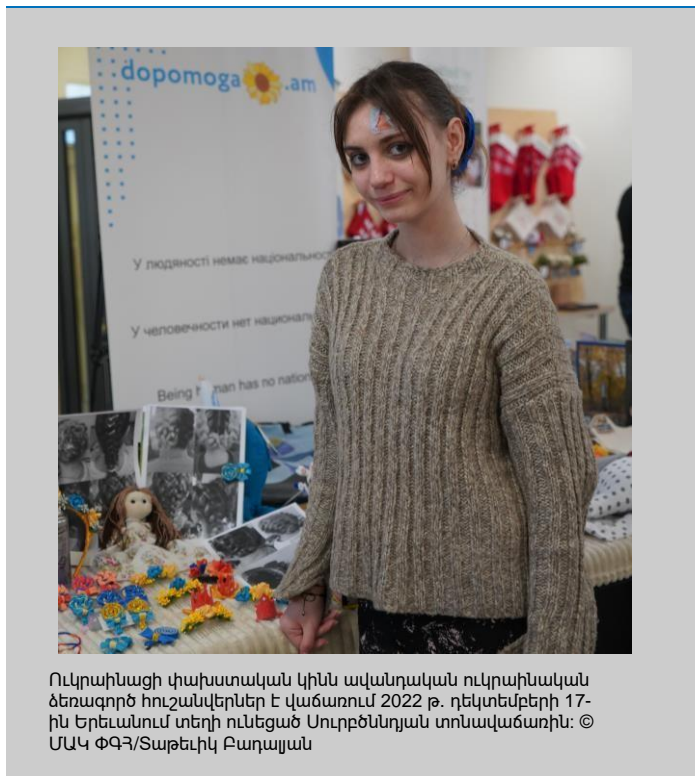
Ուկրաինացի փախստական կինն ավանդական ուկրաինական ձեռագործ հուշանվերներ է վաճառում 2022 թ. դեկտեմբերի 17-ին Երեւանում տեղի ունեցած Սուրբծննդյան տոնավաճառին:

Խաղաղ գոյակցություն, ներառում. «Ուկրաինական ֆորում» եւ «Սյունիք-գարգազում» ՀՀ-ների հետ համագործակցությամբ կազմակերպվել են մի շարք միջոցառումներ, ինչպիսիք են TED գրույցները, ձեռարվեստի նմուշների վաճառք, երաժշտական միջոցառումներ, հանդիպում հայտնի ուկրաինացի գործիչի հետ եւ ինտերակտիվ դասընթաց «Ընդդեմ գեղերային բռնության ակտիվության 16-օրյակի» վերաբերյալ: