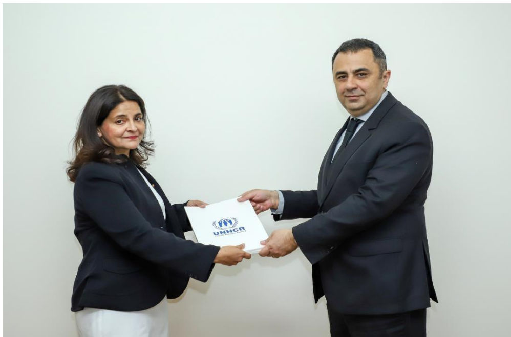
ՀՀ արտաքին գործերի փոխնախարար Վահե Գեւորգյանի հանդիպումը Հայաստանում ՄԱԿ ՓԳՀ Նորանշանակ ներկայացուցիչ տ-ն Կավիտա Բելանիին: Մարտի 17, 2023 թ., Երեւան, Հայաստան