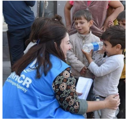
Նոր ժամանած փախստական երեխաները սպասում են Գորիսի գրանցման կենտրոնում, Այունիքի մարզ, սեպտեմբերի 29, 2023 թ.:

ՄԱԿ ՓԳՅ-ն երախտապարտ է դոնոր կառույցներին՝ աջակցության համար. Բելգիա | Կանադա | Դանիա | Ֆրանսիա | Գերմանիա | Իռլանդիա | Նիդեռլանդներ | Նորվեգիա | Շվեդիա | Շվեյցարիա | Միացյալ Թագավորություն | Ամերիկայի Միացյալ Նահանգներ