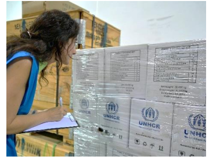
ՄԱԿ ՓԳԿ աշխատակիցը ստուգում է 16 բեռնատարներից իրենց իրերը՝ առաջին անհրաժեշտության պարանքները 33-ում բաշխելու համար:

ՄԱԿ ՓԳԿ-ն երախտապարտ է դռնը կառույցներին աջակցության համար . Բելգիա | Կանադա | Դանիա | Ֆրանսիա | Գերմանիա | Իռլանդիա | Նիդեռլանդներ | Նորվեգիա | Շվեդիա | Շվեյցարիա | Միացյալ Թագավորություն | Ամերիկայի Միացյալ Նահանգներ