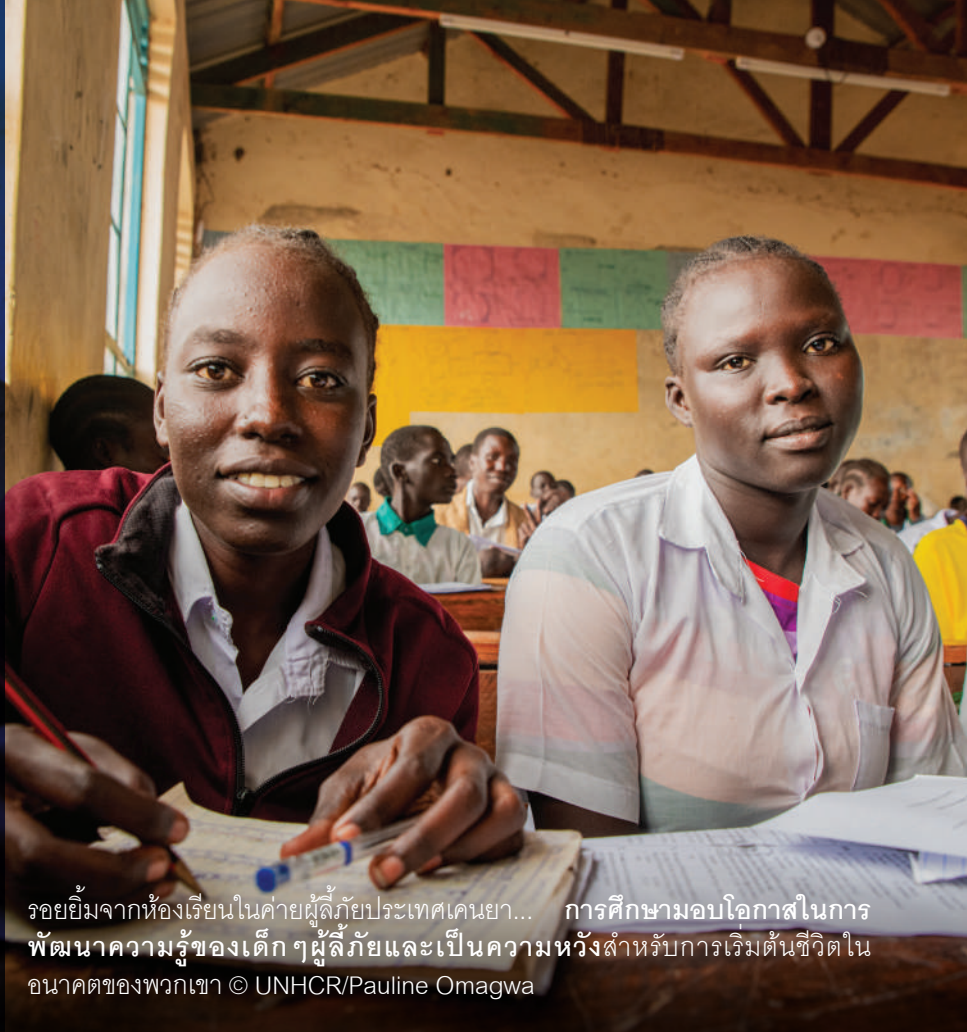
รอยยิ้มจากห้องเรียนในค่ายผู้ลี้ภัยประเทศเคนยา... การศึกษามอบโอกาสในการพัฒนาความรู้ของเด็ก ๆ ผู้ลี้ภัยและเป็นความหวังสำหรับการเริ่มต้นชีวิตในอนาคตของพวกเขา